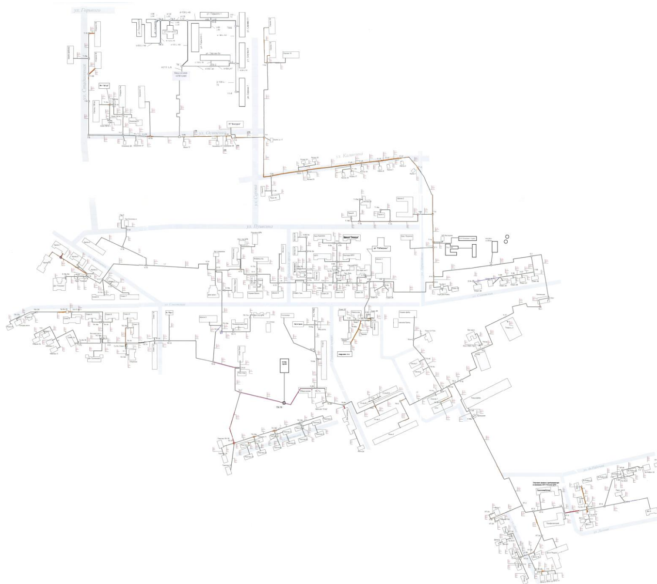
Рисунок 3 – Схема тепловых сетей Котельной №1