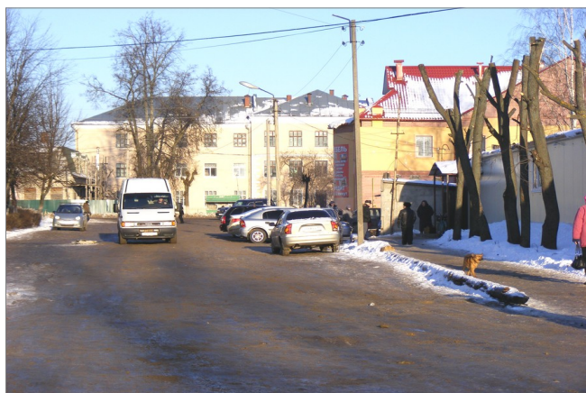
фото 1 (проезд Глушицкий г. Южа)