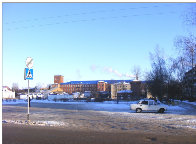
фото 3 (проезд Глушицкий г. Южа)