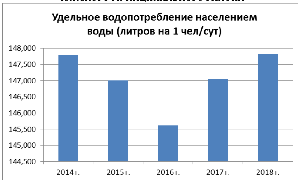
Рисунок 3.4.1 – Динамика удельного водопотребления в литрах на 1 потребителя в сутки.

Фактическое потребление воды населением, тыс. м 3 /год, в период с 2014 по 2018 гг. представлено в таблице 3.4.2.