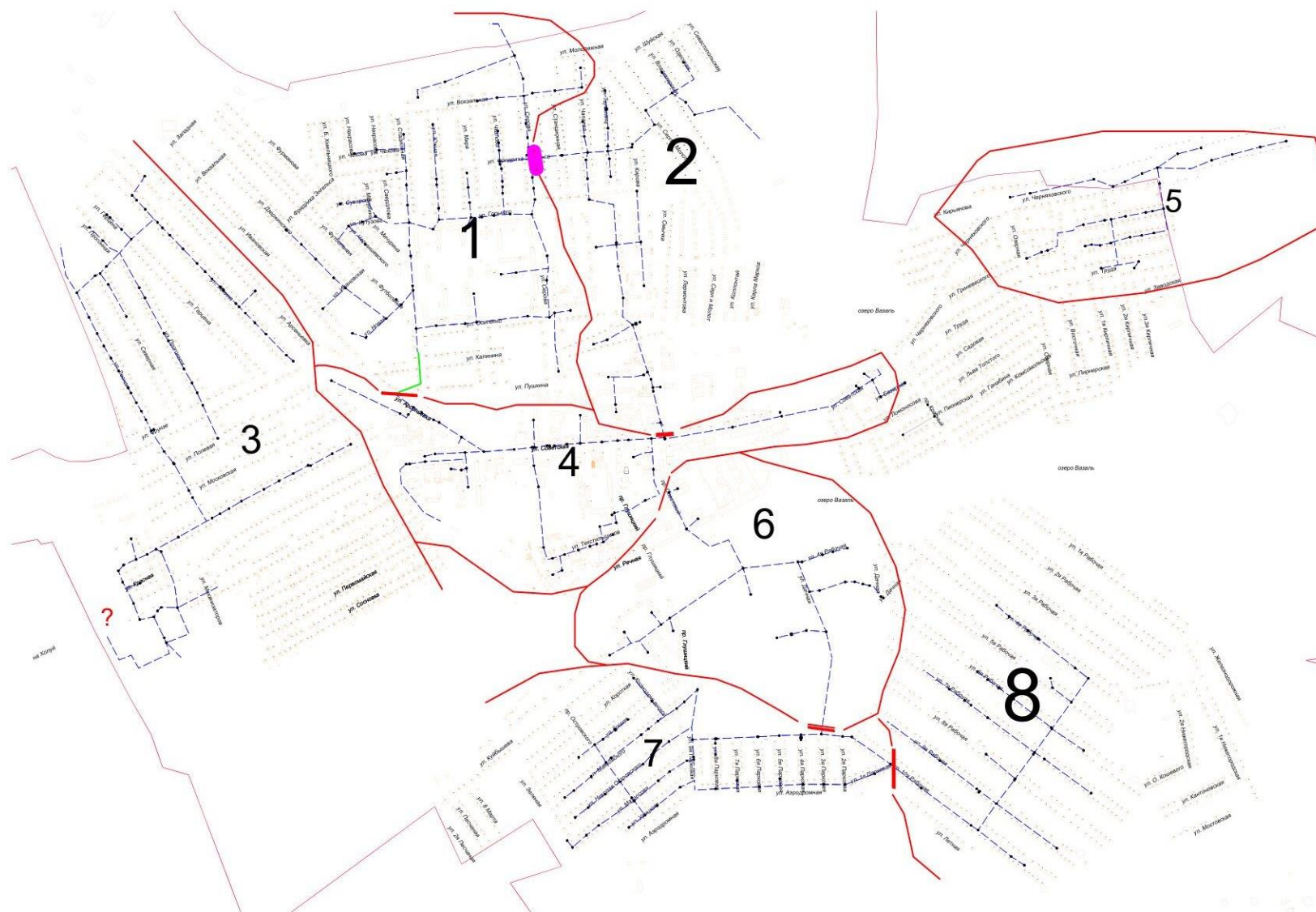
Рисунок 1 – Схема трубопроводов холодного водоснабжения